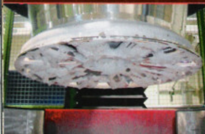
Schaumreinigung nach den eigentlichen Polierarbeiten