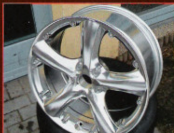
Dreistufiger Poliermarathon mit Keramikkegeln