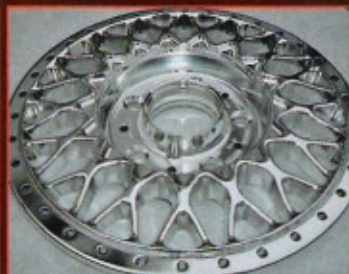
Selbst filigrane Felgensterne lassen sich bearbeiten