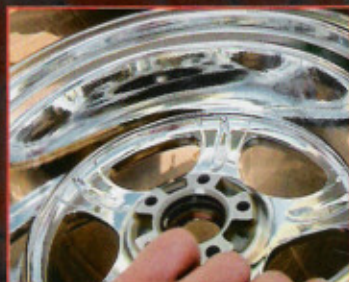
Spiegelglatt werden die Räder bis in die letzte Pore poliert

■ Text Martin Santoro